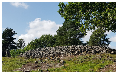
Grav med skärvstenar vid Västerängens gravfält i Igelsta.

Den 27 augusti guidade Kulturenhetens Arkeolog Ylva Tell Dahl en grupp intresserade personer av gamla forngravar. Vi började i naturområdet Färsna strax utanför Norrtälje. Ylva berättade att står man 20–25 m över havet så vet man att det under Brons- och Järnåldern var fast mark där med vatten runt om i sänkorna. Järnåldern har lämnat flest gravar och rösen. Bronsåldern inföll 1100–500 år före Kristus och Järnåldern 500 år före Kristus och in i nutida räkning. Färsna blev bebott för 3–4000 år sedan och låg då på en ö. Vi promenerade en bit in på Roslagsleden och ca tio meter in från leden så kom vi fram till en större grav och två mindre s.k rösen. Den stora gravan var nersjunken i mitten och där i ser vi en del av en stor plattare sten som kallas stenkista. Det är en skelettgrav från Bronstiden. Man placerade stenkistan ovanpå den döde och byggde sedan upp gravan med stenar. Dessa gravar är inte utgrävda.