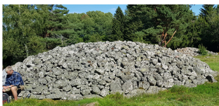
Utgrävd yngre järnåldersgrav från Igelsta.

privat mark. Här röjdes området fritt från sly i våras. Området är stängslat då det är tänkt att ungdjur ska beta där och hålla slyn borta. Men ungdjuren vägrade att gå in där av någon okänd anledning. Kan det spöka där? På denna höjd ligger ca. 105 gravar och vi är nu 25 m över havet. Fem av gravarna är utgrävda och i tre av dessa har man hittat fynd som visar att gravarna är från yngre Järnåldern. I boningshusen användes stenar i kokgropar och härdar och de kastades ut när de var förbrukade och hamnade då på kanten av en grav. På grund av skärvstenarna (de brända stenarna) på 2–10 cm i storlek kunde arkeologerna se vilken sida om gravan husen låg.