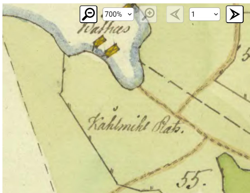
Kolmileplatsen markerad på 1780 års storskifteskarta för Issjö by.

För Issjöbönderna blev försumligheten en dyr affär - 5 Daler silvermynt i böter och fullgörandet av eventuell återstod av leveranserna för åren 1725-27.