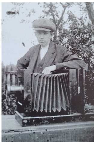
Föreningen förfogar över en stor samling av bygdefotografen Sven Erikssons fotografier.

Efter bildvisningen fick vi tillfälle att bekanta oss med föreningens arkiv, som bestod av många pärmar med egen forskning, avskrifter av handlingar och tidningsklipp samt fotografier rörande olika byar men också gårdar och skolor. Såväl skolfoton som konfirmationsbilder fanns i arkivet.