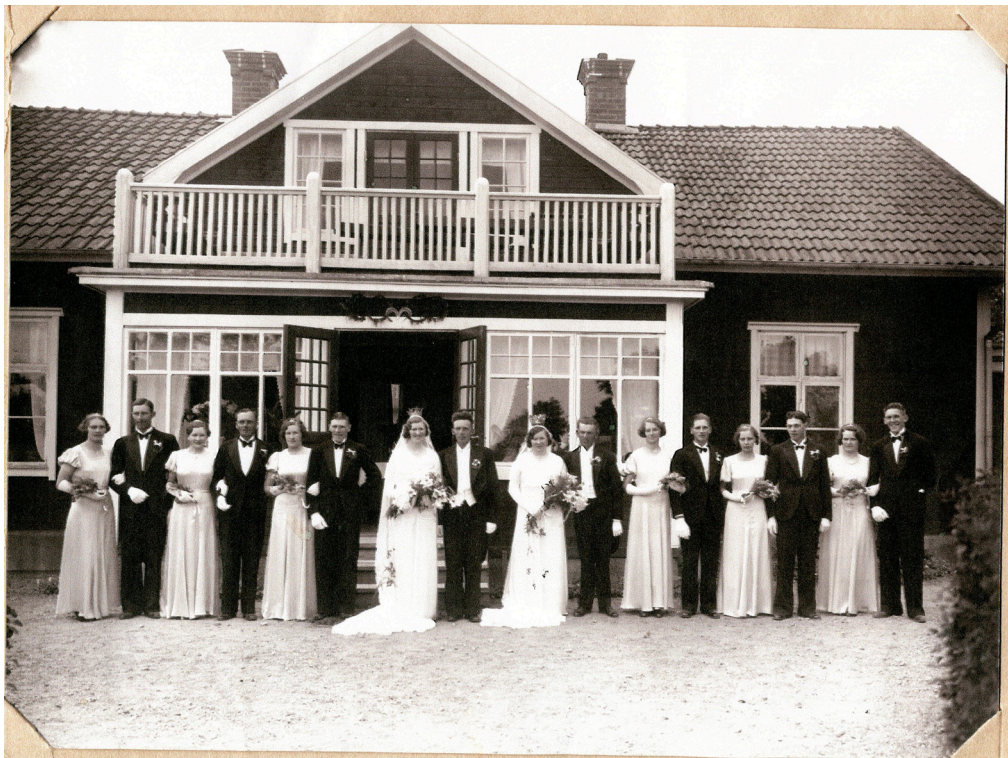
Ur fotoalbumet. Kolsta 4:1