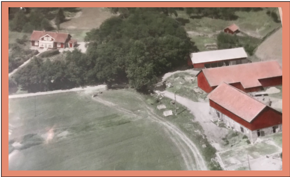
Gården Kolsta 4:1, Södergården, flygfoto. Mangårdsbyggnaden i övre vänstra hörnet.