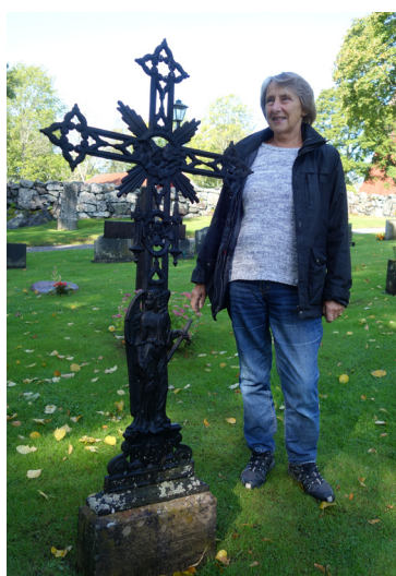
Vår guide vid ett av kyrkogårdens vackra järnkors.