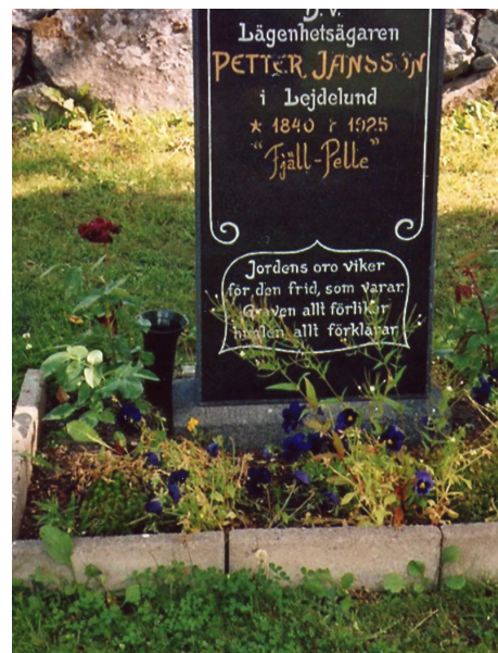
Fjäll-Pelles grav på Närtuna kyrkogård