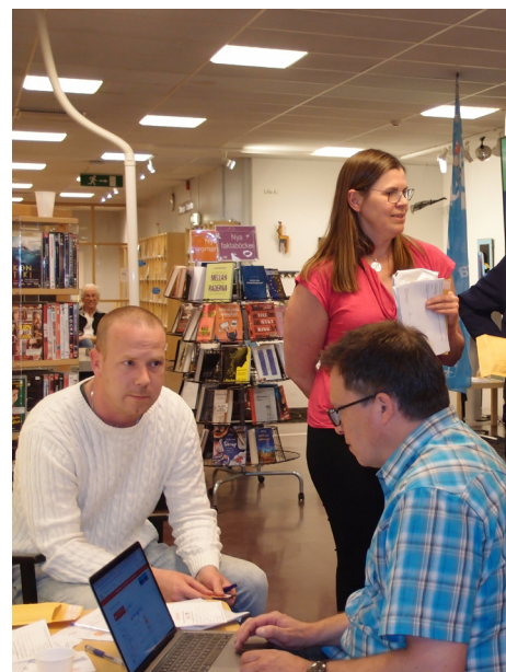
Efter föredraget vidtog topsningen. Denna tog sin rundliga tid eftersom så många som 40 personer passade på då den 25 april var den Internationella DNA-dagen och priset därför ordentligt nedsatt.