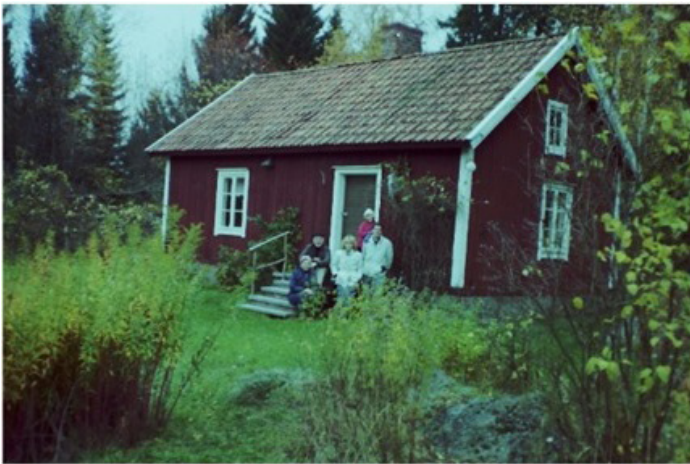
Samma stuga nu ombyggd till sommarnöje