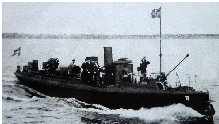
Torpedbåt U 73

I polisutredningen framkom att Boustedt suttit vid rodret och att kursen in till hamnen tagits i rät linje, vilket gjort att man kommit för nära Rådmanölandet, det vill säga på fel sida i farleden. Torpedbåten hade gått från Norrtälje vid niotiden på kvällen, det var rätt mörkt och vädret var disigt. Båda båtarna iakttog varandras lanternor men girade så att kollisionen var oundviklig. Polisutredningen slog fast att felet måste tillskrivas motorbåten, som framförts på fel sida i farleden och med otillräckliga lanternor. Arrangemanget bestod av en topplanterna uppsatt på en båtshake i förstäven, och hade tagits för ett akterljus av torpedbåtens befälhavare.