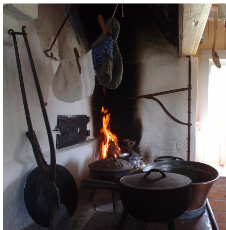
En munter brasa sprakade i båtsmanstorpets när vi kom in.