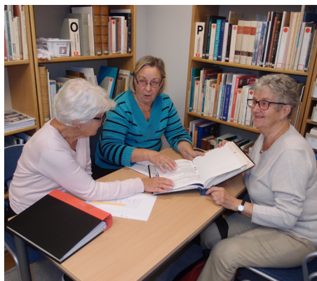
Tre damer som hjälpte varandra

Om medlemmarna så önskar så träffas vi på detta sätt igen!