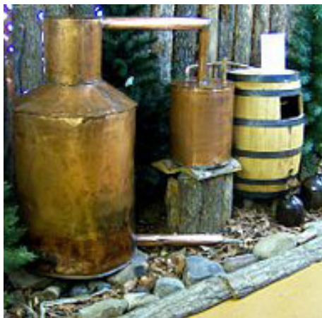
Brännvinspanna med kylare av äldre typ

Under loppet av 1700-talet blev sedan bränning allt vanligare och brännvinet utvecklades till en stor politisk stridsfråga.