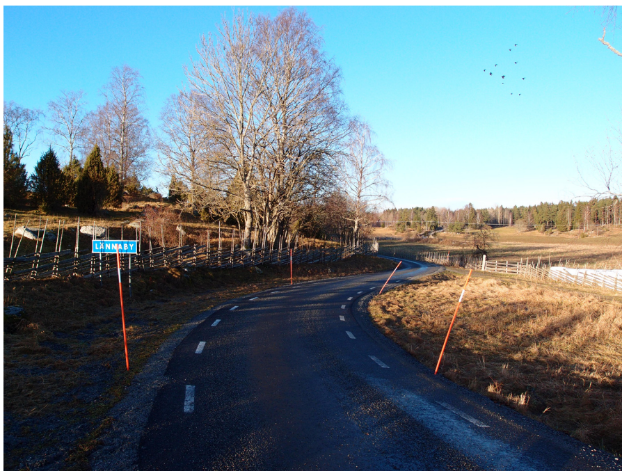
Byvägen i Lännaby i början av januari strax innan snön kom och förändrade bilden. Endast pinnarna som markerar vägrenarna påminde om att det ännu var vinter.

Glöm inte att meddela NSFF om du ändrar adress!