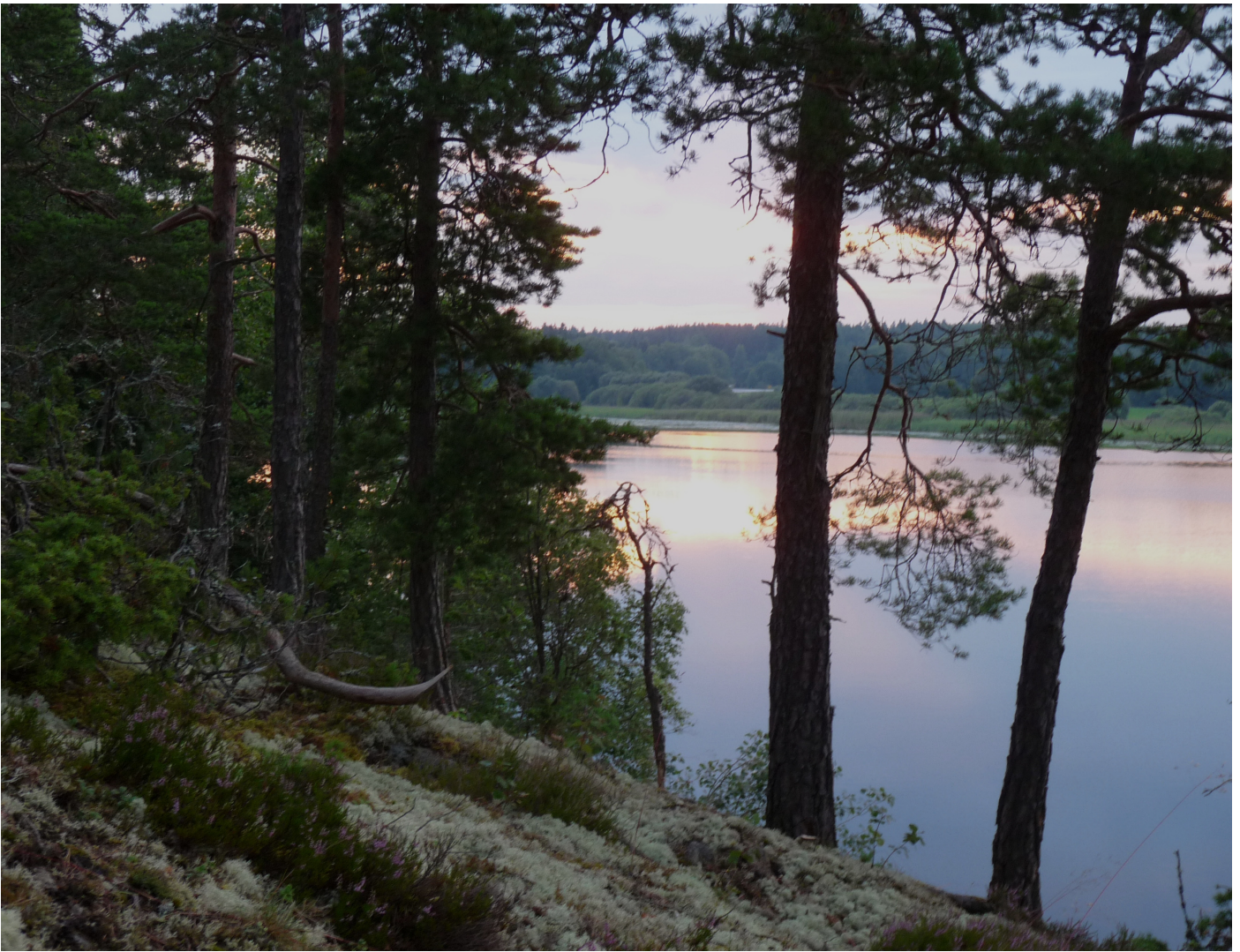
Sjön Sottern sedd från berget på sydsidan, med Ytterbys ägor i bakgrunden, foto: Birger Björnerstedt

Mattsson under årens lopp, att uppge tre olika födelseorter, Edsbro, Knutby och Almunge, när han flyttar mellan gårdarna, lite beroende på var han senast har arbetat som dräng. De hade tydligen inte så noga reda på det där, varken han eller prästerna. Han finns inte noterad i någon av "Födelse- och dopböckerna" i grannsocknarna heller.