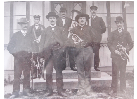
Vaddös musikkår 1910-20-talet

Ett par timmar förflöt mycket snabbt hos denne idoge man och hans likaledes idoga fru. Ett mycket trevligt besök.