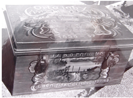
Ortala bykista, med påskriften laga skifte 1858-59 - en guldgruva för släktforskare.

Men Sven har inte bara anfäder i Roslagen, många kommer också från socknar i Västmanland, Södermanland, Östergötland och Dalsland.