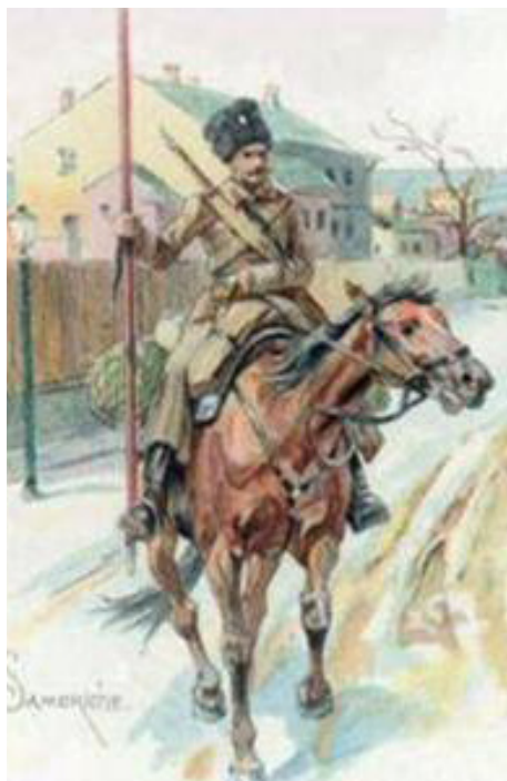
Kosack till häst

tillhörde borgerskapet – många manliga invånare befann sig nämligen uppe i Botenhavet på strömmingsfiske. Samtliga närvarande var försedda med gevär, där dock ingen hade hunnit få någon som helst utbildning i försvarsstrid. Fienden antände staden på ett flertal ställen och elden spred sig med en explosionsartad hastighet i den starka sydostliga vinden. Ryssarna lämnade staden ganska omgående, rodde ut till de större fartygen, vilka genast satte segel med kurs mot havet och där de förenades med den övriga eskadern.