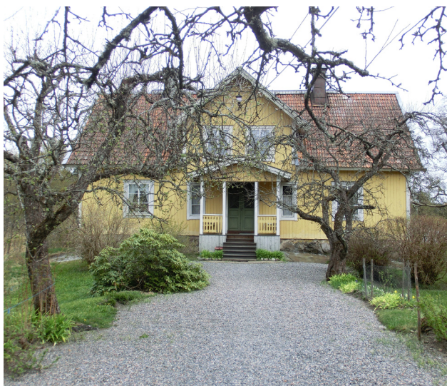
Mangårdsbyggnaden till Fiskarudden.