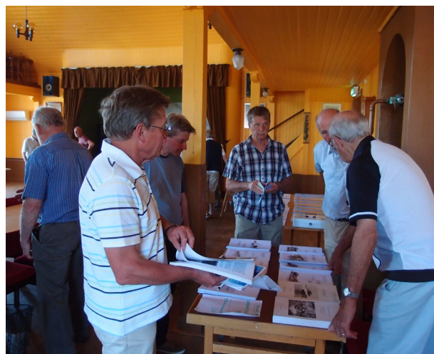
Båda föreningarna presenterade sina skrifter och åtminstone några bytte ägare under dagens lopp.

Anbladet återkommer i höst med ett fylligare reportage.